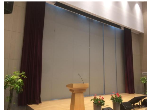
东南 e 馆 中分三折 9000*6000 门系统