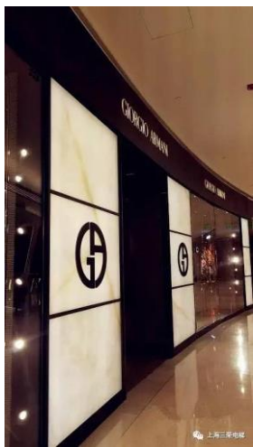
为乔治阿玛尼个性定制 450KG 1.5M/S 小载重乘 客电梯