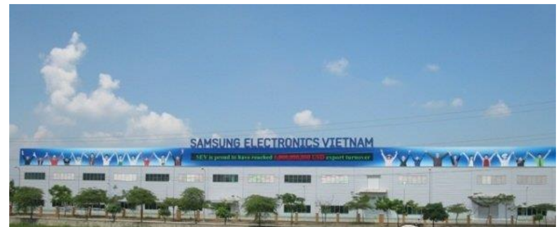
越南三星工厂，菲律宾三星工厂，韩国三星工厂等货梯 规格：中分双折防火门 (2000-3000) x (2100-2800)