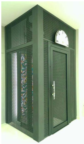
2:1 液压家用梯配电子锁 手拉门系统